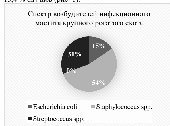
Рис. 1. Спектр возбудителей маститов крупного рогатого скота в хозяйствах Ленинградской области

В пробах молока ( n = 20 ) от коров с инфекционным маститом выявлено 26 патогенных микроорганизмов. Среди них грамотрицательные бактерии, а именно Escherichia coli ( n = 4 ), были установлены в 15,4 % случаев (рис. 1).